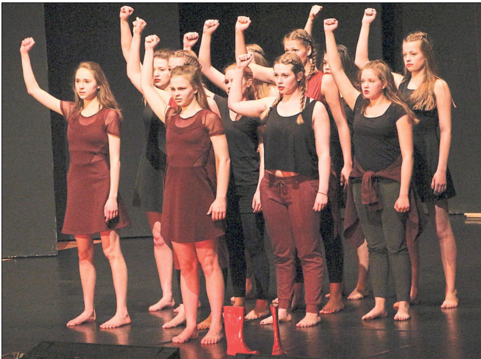
Im Tanzprojekt »Kein Raum für Missbrauch« setzen sich die Tänzerinnen des TC Linon künstlerisch mit sexualisierter Gewalt auseinander. Insgesamt mehr als 150 Aktive standen bei der Veranstaltung in der Rudolf-Steiner-Schule auf der Bühne.